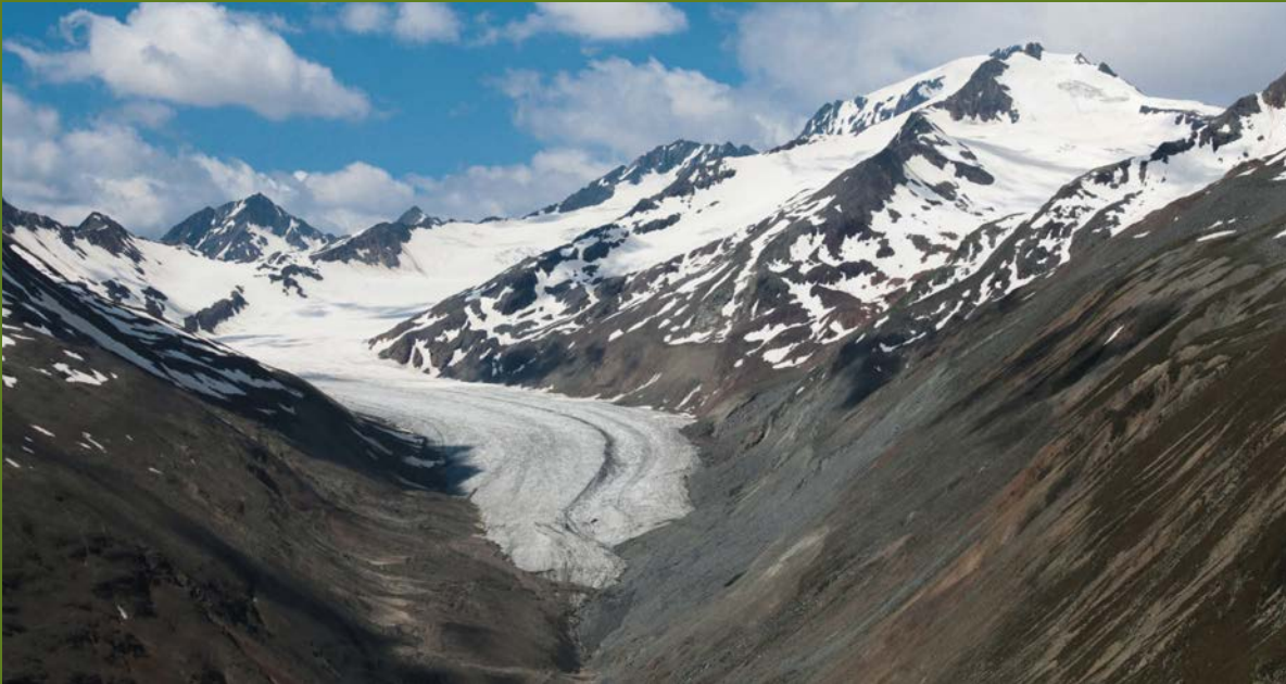
Der stark abgeschmolzene Hintereisferner im Sommer 2018

Zur aktuellen Gletscherforschung im hinteren Ötztal