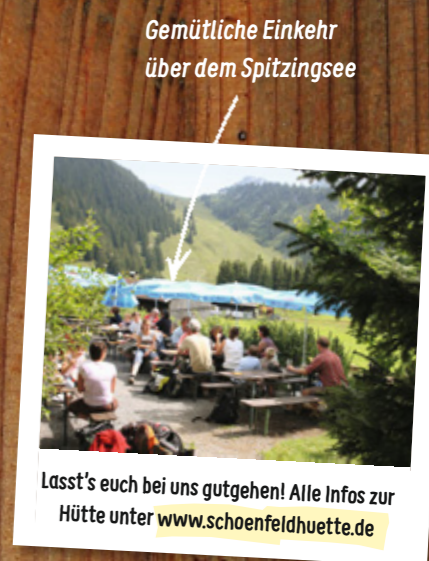
Gemütliche Einkehr über dem Spitzingsee Lasst's euch bei uns gutgehen! Alle Infos zur Hütte unter www.schoenfeldhuette.de

Vom Spitzingsattel auf die Schönfeldhütte – mein Tipp für eine gemütliche und kurzweilige Bergwanderung vor den Toren Münchens. Wer es etwas sportlicher mag, geht noch auf den Jägerkamp und genießt anschließend einen leckeren Kaiserschmarrn auf der Schönfeldhütte.