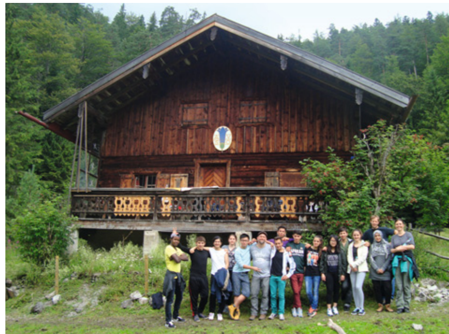
Gruppenbild vor der Kloaschaualm