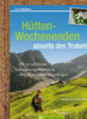
Wanderführer mit vielen Vorschlägen für schöne Touren z. B. in den Bayerischen Bergen