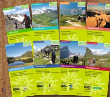
Außerdem perfekt ausgearbeitete Tourenfallblätter und Hüttenrekking-Touren

Kompetente Beratung zu Wetter, Verhältnissen, Tourenmöglichkeiten in den Servicestellen