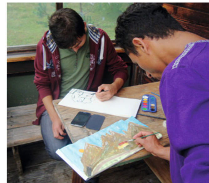
Kunst am Berg