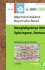
Kartenmaterial für die gesamten Alpen