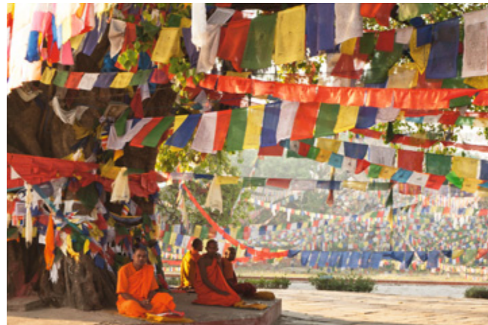
Farbenprächtige Stille: Gebetsfahnen und buddhistischer Mönch am heiligen Bodhibaum in Lumbini

dumping. Vielleicht war es in den letzten Jahren zu einfach, nach Nepal zu reisen.