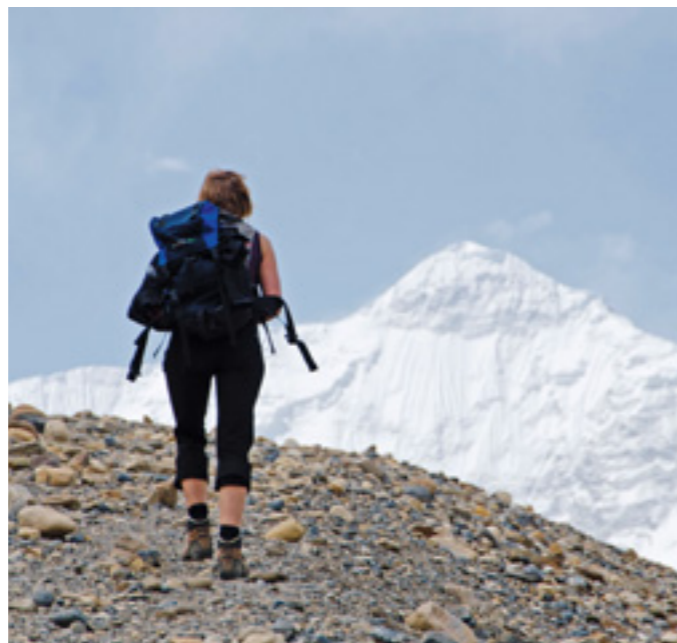
Den hohen Pässen entgegen – im Hintergrund leuchtet weiß die Nordflanke des Nilgiri