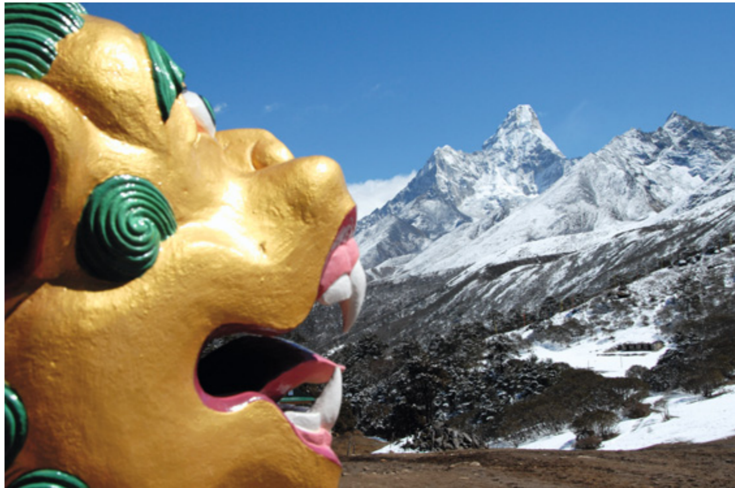
Symbolisch: Der Schneelöwe am Kloster von Thengboche blickt wachsam zur Ama Dablam (6865 m).