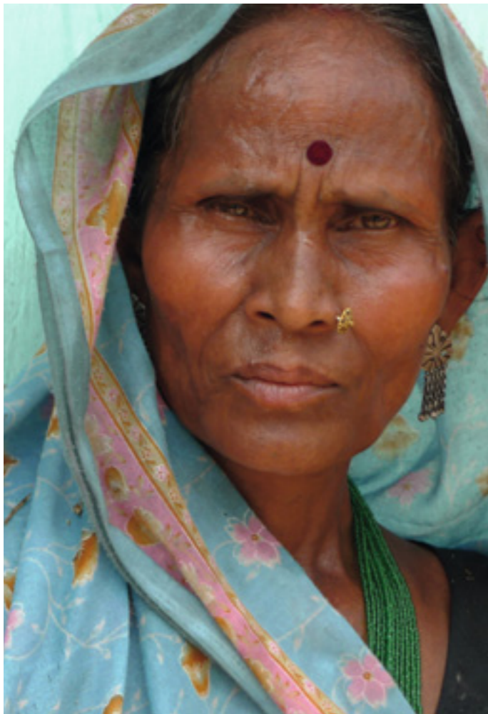
Nepal, das sind nicht nur Sherpas und tibetische Mönche – eine Bauersfrau aus dem Tiefland des Terai