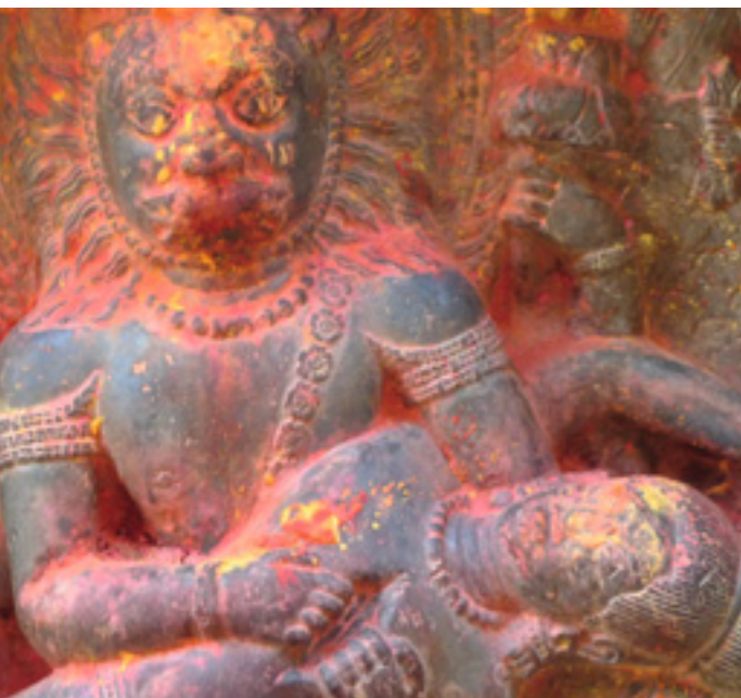
Mythen und Legenden wie von Vishnu als Mann-Löwe zeigen die fantasievolle Bandbreite der indischen Religionen